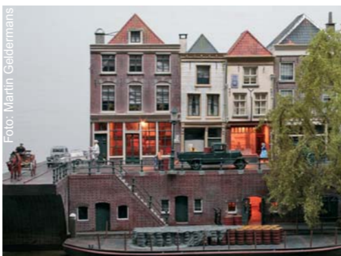
A4-dioramawedstrijd / Dioramenwettbewerb / Diorama contest. >20 Diorama's. Doe mee / Take part / Teilnehmen noch möglich.